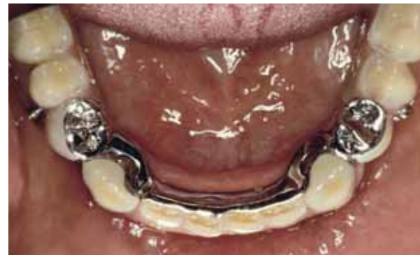
Frameprothese in de mond. De ankerarmen zijn enigszins zichtbaar.