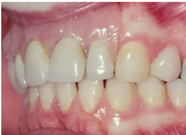
Plaatprothese van opzij