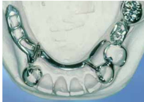
Frameprothese in metaal op een gipsmodel, zonder roze kunststof en kunsttanden en -kiezen

De frameprothese heeft een basis van metaal. Op het metaal is een roze, tandvleeskleurige kunsthars aangebracht. Daarin zitten de kunsttanden en -kiezen vast. In tegenstelling tot de plaatprothese rust de frameprothese vooral op de overgebleven tanden of kiezen en soms voor een deel op het slijmvlies van de mond. Met metalen ankers die op de tanden of kiezen steunen en met hun ankerarmen er omheen klemmen, is de frameprothese op de tanden en/of kiezen bevestigd. De ankerarmen zijn vaak wel enigszins zichtbaar.