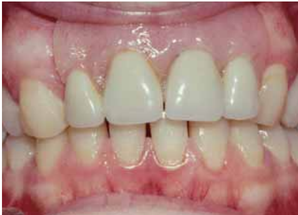
Plaatprothese van voren

De plaatprothese is gemaakt van een roze, tandvleeskleurige kunsthars. Daarin zijn de kunsttanden en -kiezen verankerd. De prothese rust in zijn geheel op het slijmvlies van de mond en zit eventueel met haakjes vast aan de overgebleven tanden of kiezen.